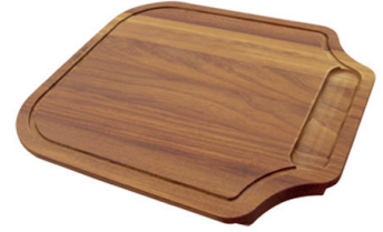
伊罗科木砧板 8655 000