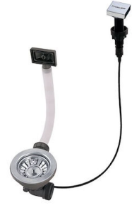
自动下水器 LIRA 8407 102