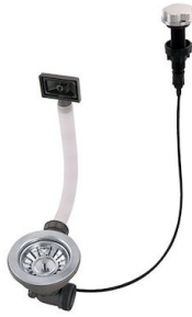
自动下水 8407 000